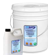
Contrôle des particules