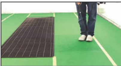
Vaporisez quotidiennement avec le produit de contrôle des particules