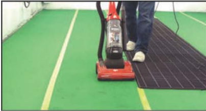
Passez l'aspirateur quotidiennement 1 afin d'éliminer les contaminants