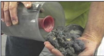
Quantité typique de saleté enlevée chaque jour

1 Avertissement! Ne pas installer ou retirer le tapis, ni passer l'aspirateur sur le tapis ou le sol nu en présence de concentrations explosives de matières inflammables, car des décharges d'électricité statique peuvent se produire pendant ces manipulations. Toujours ventiler complètement la chambre à peinture afin d'éliminer les vapeurs et poussières inflammables avant de procéder.