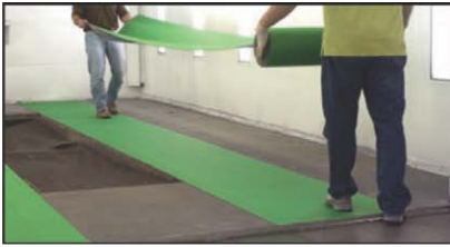
Installation rapide en moins de 30 min.