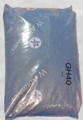
Sac = 55 lb