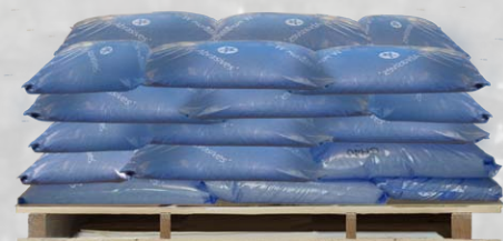
Palette = 40 sacs