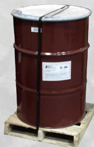
Baril = 1 700 lb