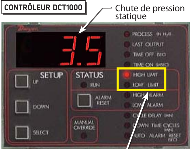
Limite haute / Limite basse