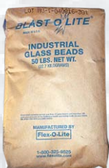
Sac = 50 lb