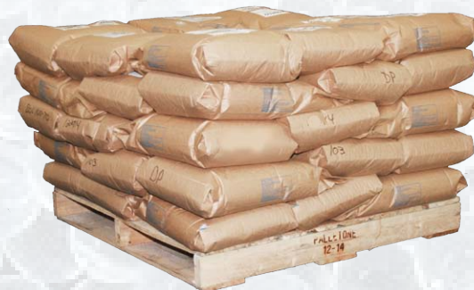
Palette = 40 sacs