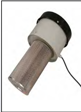
Filtre de collecteur de poussière