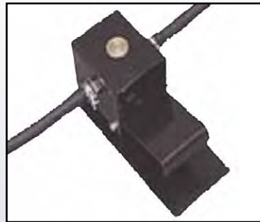
Valve au pied