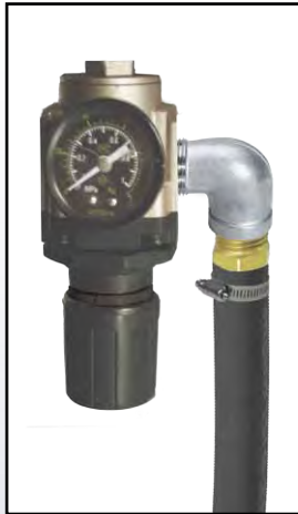
Jauge de régulateur d'air