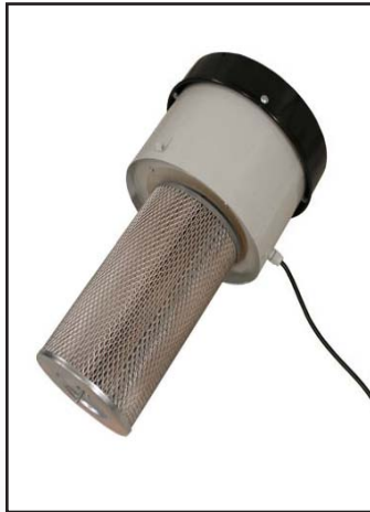
Filtre de collecteur de poussière