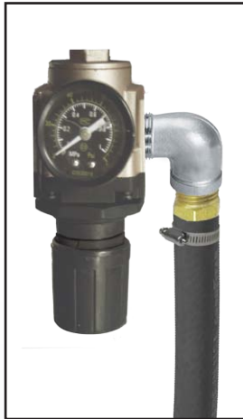
Jauge de régulateur d'air