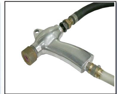
Pistolet de sablage