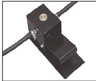
Valve au pied