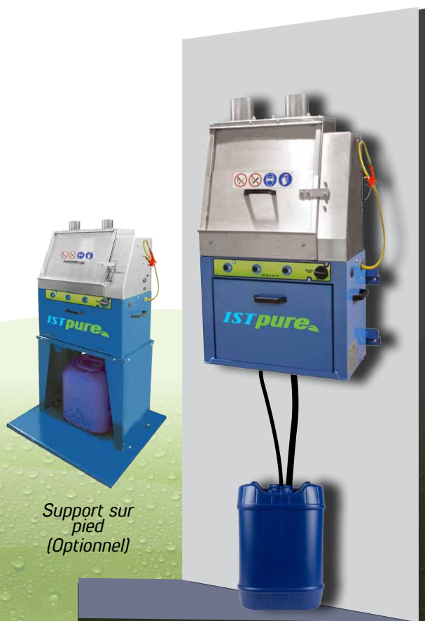
Support sur pied (Optionnel)