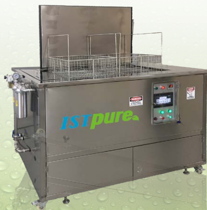
UC 3624LT/UC 4230LT