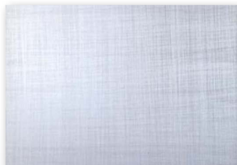
Couleur transparente lorsqu'il a séché

La formulation claire se vaporise dans une couleur bleutée opaque et devient ensuite claire en séchant.