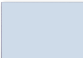
Couleur bleue opaque lorsqu'il est appliqué