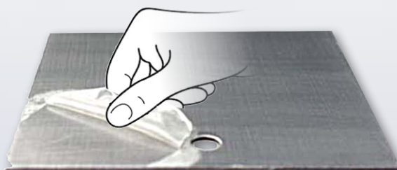
Se pèle facilement

La nouvelle formulation, plus opaque et d'un blanc éclatant, vous donnera un fini supérieur d'un blanc brillant pour une meilleure visibilité des couleurs.