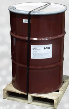
Baril = 1 700 lb