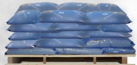
Palette = 40 sacs