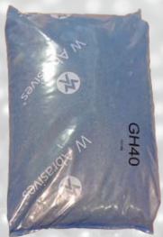
Sac = 55 lb