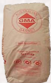
Sac = 55 lb