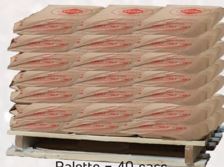
Palette = 40 sacs