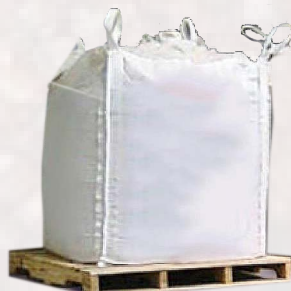
Super sac = 2 000 lb