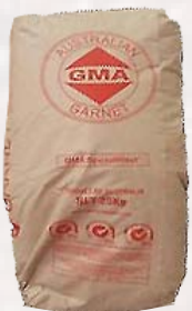
Sac = 55 lb