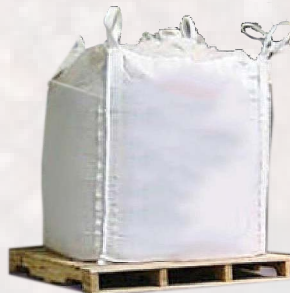
Super sac = 2 000 lb