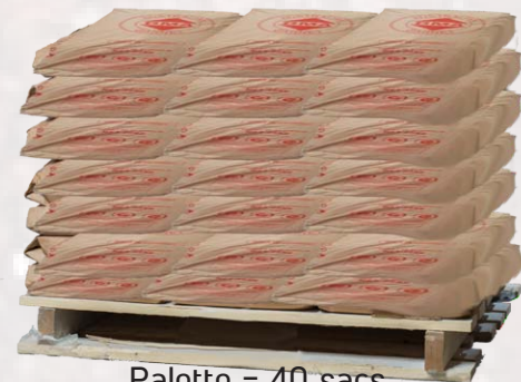
Palette = 40 sacs